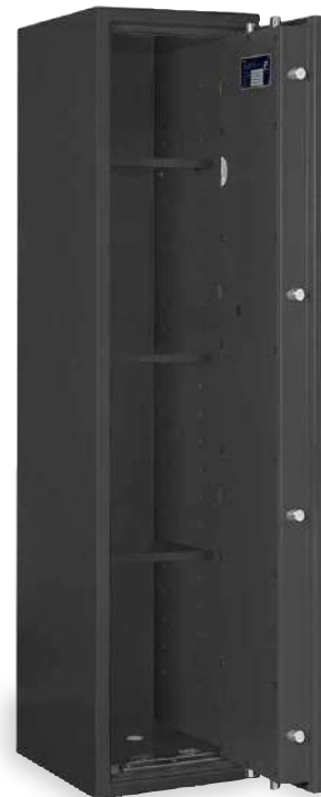
LB ZERO 11/C