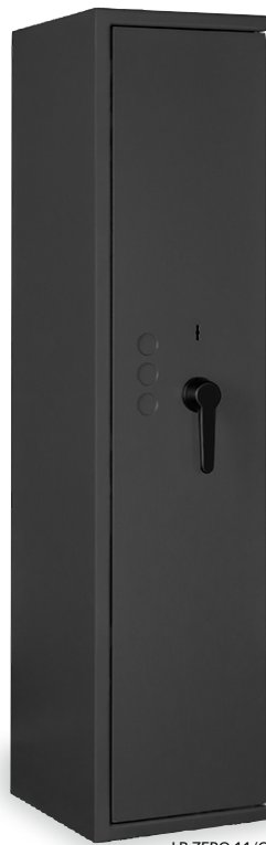
LB ZERO 11/C