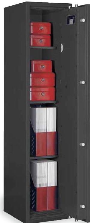
LB ZERO 11/C