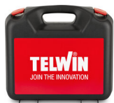
VALIGETTA IN PLASTICA 322800