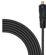
CAVO TW05V-A 1X025 L=1.80M SPINA 124589