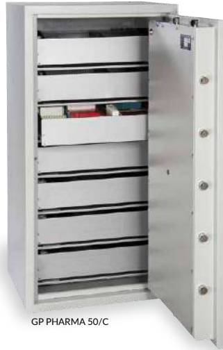
GP PHARMA 50/C