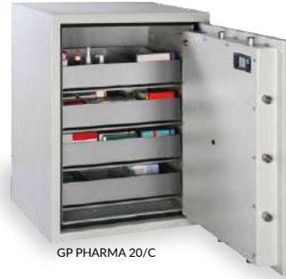
GP PHARMA 20/C