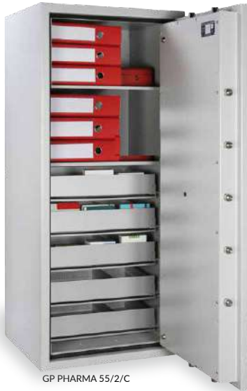
GP PHARMA 55/2/C